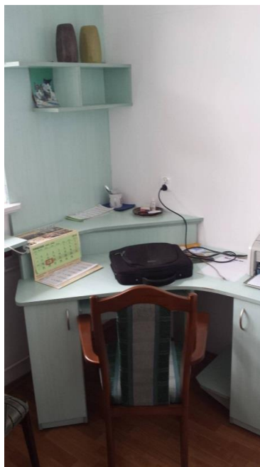
Rys. 1. Pokój badanego nauczyciela akademickiego – widok na stanowisko pracy

Stałe obcowanie z grupą studentów naraża prowadzącego na uciążliwości związane z hałasem, a konieczność ciągłej słownej komunikacji zwiększa ryzyko chorób narządu głosu.