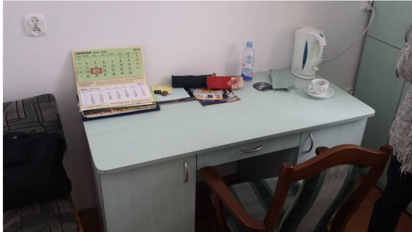
Rys. 2. Pokój badanego nauczyciela akademickiego – widok na stanowisko pracy nauczyciela dzielącego pokój