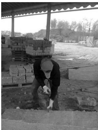
Rys. 3. Praca młotem pneumatycznym