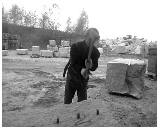
Rys. 5. Praca młotkiem ręcznym