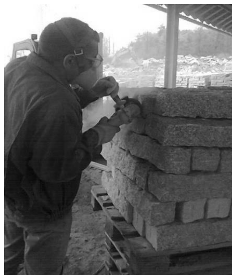
Rys.4. Praca szlifierką