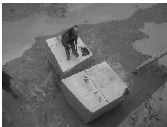
Rys.1. Stanowisko pracy górnika-skalnika

Na rysunku 1 przedstawiono stanowisko pracy górnika-skalnika w czasie rozpychania bloku skalnego.