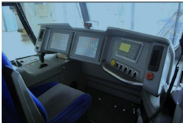
Rys. 2. Kabina motorniczego [12]