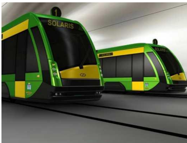
Rys. 1. Pojazd tramwajowy, za którego obsługę odpowiada motorniczy [16]

Motorniczy narażony jest na wiele zagrożeń mogących być następstwem niepoprawnego użytkowania tramwaju. Jego stanowisko pracy obejmuje wiele obowiązków i funkcji, które musi wypełnić.